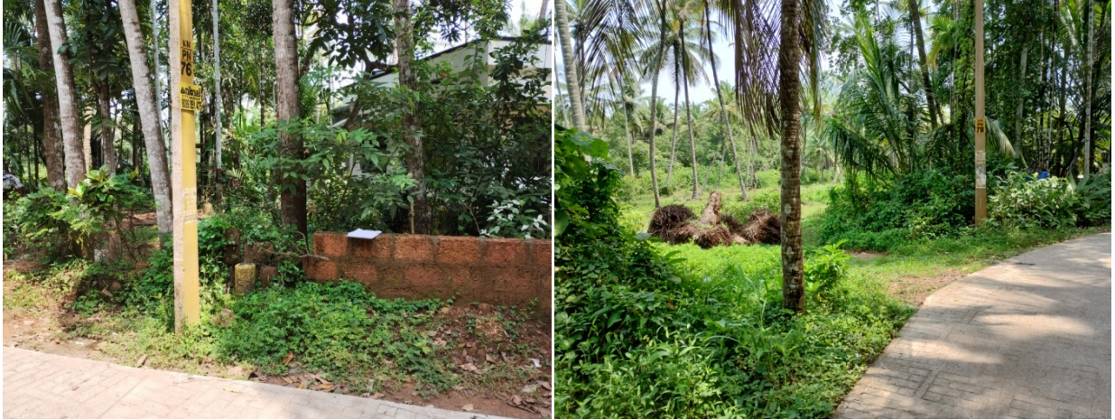
ബാധിത ഭൂമി - വില്പുർ