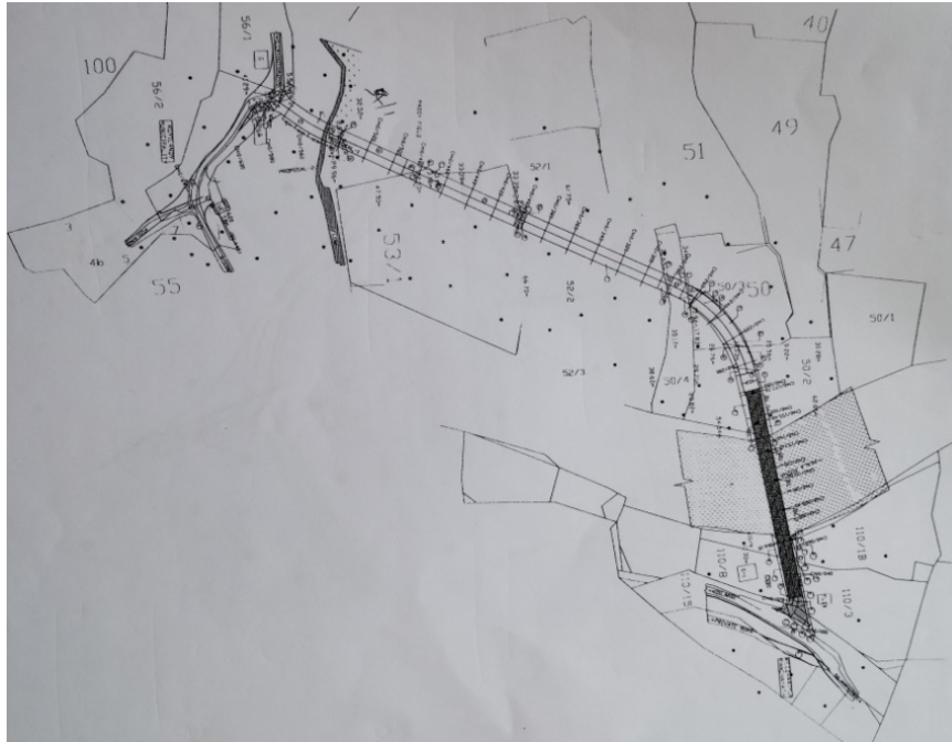
പദ്ധതി പ്രദേശത്തിന്റെ രൂപരേഖ