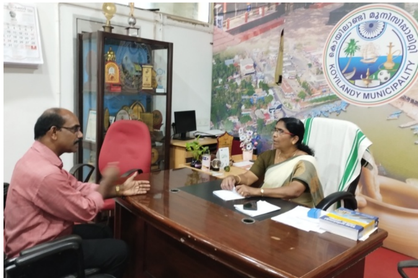
നഗരസഭാധ്യക്ഷയിൽ നിന്നു വിവരം ശേഖരിക്കുന്നു